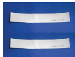
付属品：連番付き透明封印シール

サミーの「攻殻機動隊 S.A.C 2nd GIG」や「エウレカセブンAO」等の主基板制御に移行された機種で、リール上部基板ケース内への仕込みゴトが多発していますが、今後は接続ケーブルへの仕込みに手口変化する可能性があります。