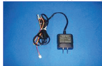
専用ACアダプター 2,000円 (税別)